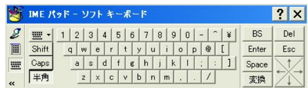
圖2 IME pad 軟鍵盤

由於標的對象難以使用鍵盤輸入，因此，利用電腦畫面顯示的軟鍵盤輸入文字。但網路上的軟鍵盤和 WindowsXP 標準配備的 IME pad 軟鍵盤(圖2)中，手指移動距離太小，殘障人士很難使用，在輸入日文假名時，滑鼠移動距離太長。亦即，在軟鍵盤上，假名輸入模式並非按五十音順序輸入假名，不甚方便，並且，點擊羅馬字輸入假名時，例如輸入「か」時必須輸入「k+a」，滑鼠的移動距離過長。