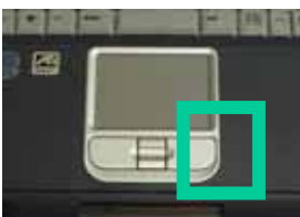
圖1 操作滑鼠時放手位置圖

標的對象是患有全身性肌肉無力與麻痺，唯一自發運動僅手關節與指尖，由於手會震動與不自主運動，因此，難以操作滑鼠等標準指向裝置。尤其是需快速連按2次按鍵的雙擊動作，與持續壓住按鍵，並在滑鼠墊上移行拖曳，相當困難。此外，由於腕部肌力不足，會將手放在筆記型電腦上操作滑鼠板。此時，由於右手放在圖1的位置上，不小心會壓到右擊按鍵，導致失控。