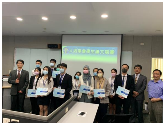
圖 9 學生論文競賽頒獎（左：大學組，右：研究所組）