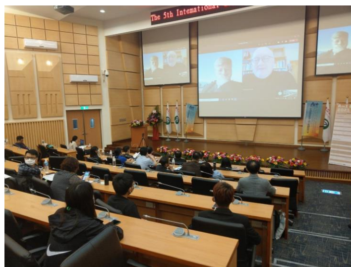
圖 5 專題演講（二）：Klaus Bengler 教授

3月20日下午最後的議程是由 德國人因工程學會理事長 Klaus Bengler 教授 帶來的「New Challenge to Modern Human-Machine Systems」專題演講，雖受限於疫情而僅能透過視訊跟與會者分享、互動，但其豐富的實務經驗仍清楚地啟發了在場聽眾。