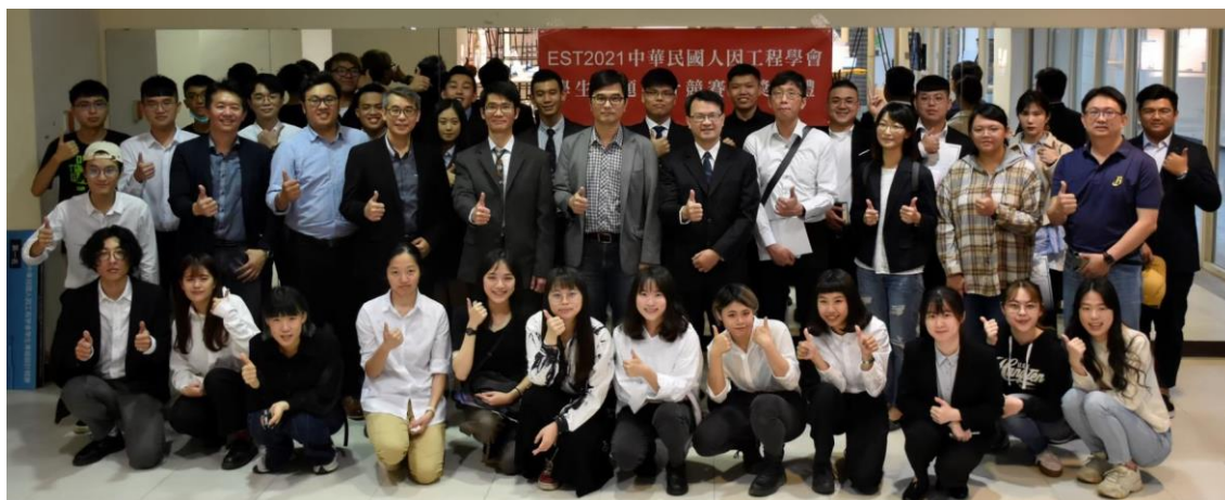
圖 10 學生設計競賽頒獎