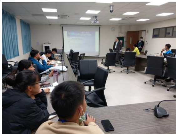
圖 8 海報發表