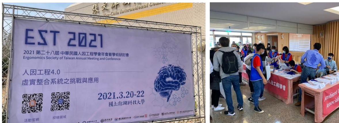
圖 1 大會會場入口（左）與首日報到情形（右）

本屆大會先於 3 月 12 日在 朝陽科技大學 舉辦學生論文競賽決賽、3 月 19 日傍晚在 國立澎湖科技大學 召開第十四屆理監事第八次會議，將於本期後續主題報導中分別專文介紹。3 月 20 日當天則是自 08:00 開始報到，隨後即為大會開幕式。