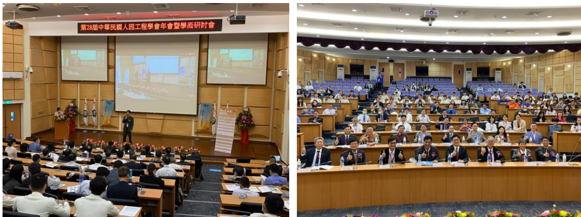
圖 2 大會主席致詞（左）及與會佳賓合影（右）

3月20日上午，由大會主席 吳欣潔 理事長及各界嘉賓致詞後，本屆大會即正式地揭開序幕，由科技部工業工程與管理學門的 范書愷 召集人帶來第一場專題演講「Digital Twin with Smart Manufacturing and Digital Transformation」，呼應本屆大會主題。