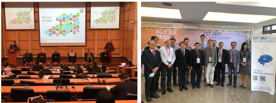
圖 6 醫療人因論壇