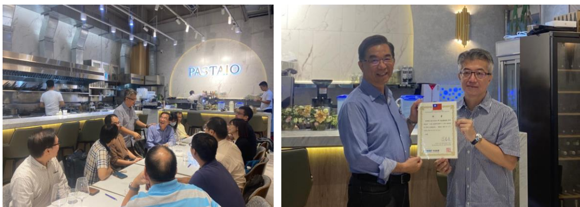
圖 1 科技部人因工程與設計子學門籌備委員第一次工作會議